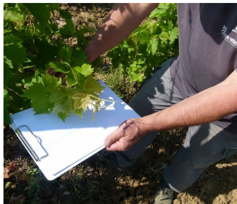
Thrips- Technique de battage des grappes

Le battage doit se réaliser sur une surface blanche rigide. Batta plusieurs fois les grappes et/ou les pousses terminales et attendre quelques secondes. Observez le déplacement des thrips jaune orangé avec une taille de 1mm maxi.