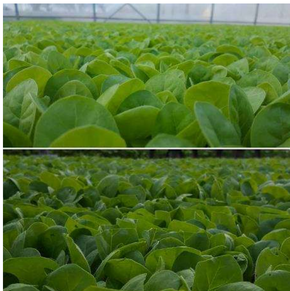
Tabac avant faucillage (photo du haut), tabac faucillé (photo du bas)

Les semis de référence sont au stade moyen « prêt à planter ». Les tabacs ont été faucillés sur la plupart des parcelles de référence.