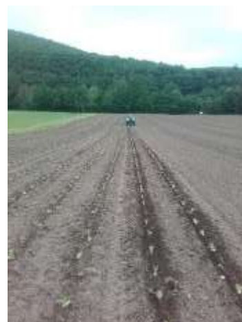
Plantation des tabacs

Dans l'ensemble les plants sont sains. Seule la parcelle d'Amuré (79) présente du Botrytis.