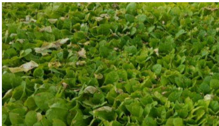
Plants atteints d'Olpidium