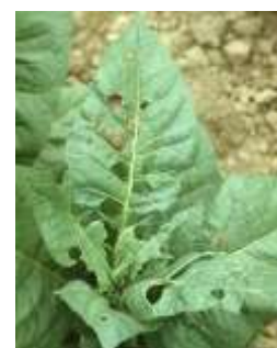
Dégâts de sauterelles

Des dégâts de sauterelles sont visibles sur les semis, en tour de plaine, des zones de Thuret (63) sur plus de 20 % des semis sur 1,5 ha.