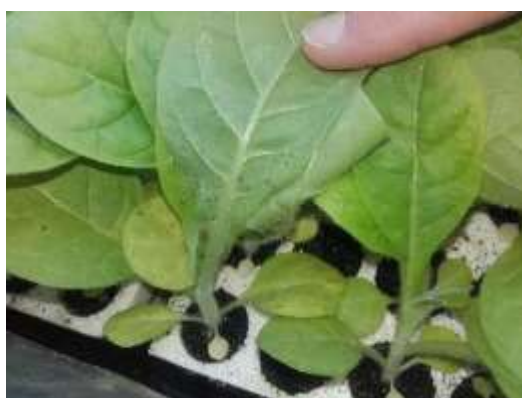
Pucerons sur plant de tabac

Des traces de pucerons sont observées sur les semis, en tour de plaine, des zones de Saussens (31), Vivonne (86) et Saint-Sylvestre-sur-Lot (47) sur un total de 47 ha.