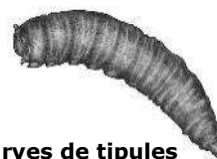
Larves de tipules

Des dégâts faibles à modérés (1 à 20%) sont observés sur les semis, en tour de plaine, de la zone de Vivonne (86) sur 16 ha.