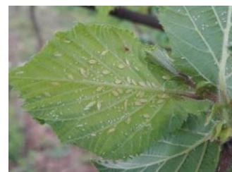
Colonie de pucerons jaunes

La présence de colonies de pucerons jaunes se traduit par un miellat sur feuille, bientôt envahi de fumagine (dépôt noir de mycélium et de fructifications d'un champignon). Des attaques répétées avec de fortes populations peuvent entraîner une baisse de la vigueur des arbres.