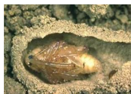
Photo 3 : Œuf au contact de l'amande en cours de croissance Photo 4 : Nymphe femelle dans la loge préparée par la larve dans le sol