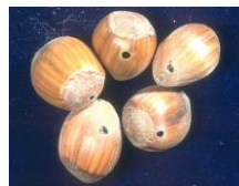
Photo 1 : Balanin mâle adulte – Photo 2 : Noisettes percées par les larves