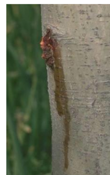
Dégât d'une larve

Les arbres affaiblis par les attaques de Zeuzère sont par la suite fréquemment atteints par d'autres ravageurs xylophages (xylébores, scolytes...).