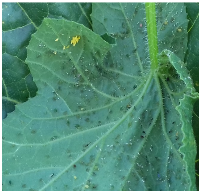
Pontes de coccinelle déposées à proximité de foyers de pucerons