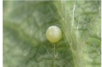
Œuf de noctuelle

Possibilité d'utiliser des spécialités commerciales à base de Bacillus thuringiensis .