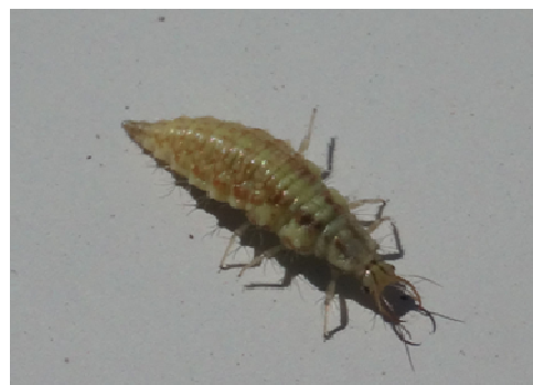
Larve de chrysope

Pour information, la larve de chrysope supporte des températures variant entre 10 et 35°C. En dessous de 10°C, son développement est freiné mais se poursuit. Elle supporte des températures pouvant descendre occasionnellement en dessous de 0°C.