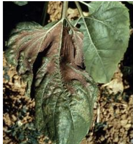
Carence en bore sur tournesol.

Petites taches jaune vif sur feuilles basses puis chlorose inter-nervaire plus ou moins large. Les tissus finissent par brunir et mourir. Les nervures restent vertes.