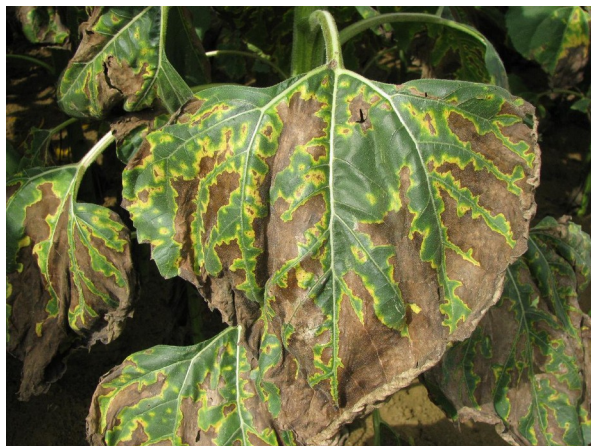
Verticillium sur tournesol.