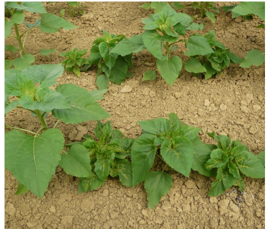
Mildiou sur tournesol.

Les conditions climatiques sont favorables aux contaminations et les premiers symptômes sur plantes sont visibles depuis environ une semaine (tournesol au stade 10-12 paires de feuilles). Les pluies régulières des dernières semaines favorisent le développement du pathogène. Surveillez vos parcelles dès le stade 6-8 feuilles.