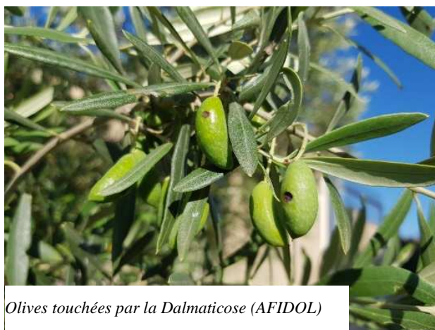
Olives touchées par la Dalmaticose (AFIDOL)

Posséder une méthode de lutte contre la mouche de l'olive efficace.