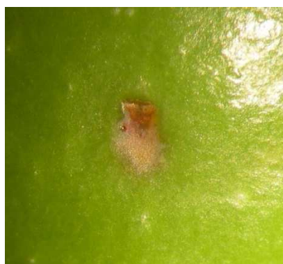
Grossissement piqûre de ponte de mouche de l'olive

En soulevant délicatement, avec un cutter, l'épiderme de l'olive à l'endroit de la piqûre de ponte, l'œuf de la mouche apparaît (0,5 mm de long).