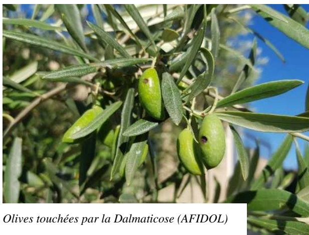
Olives touchées par la Dalmanicose (AFIDOL)

Posséder une méthode de lutte contre la mouche de l'olive efficace.