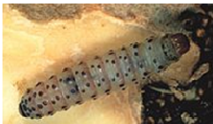
Larve de Pammene fasciana beige rosé