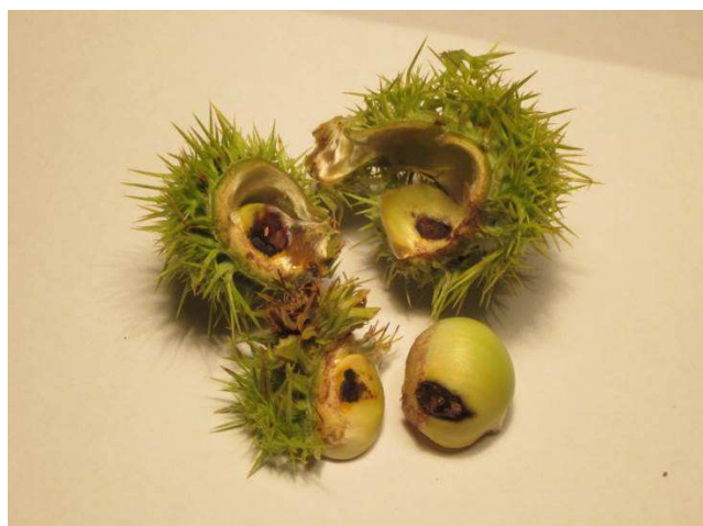
Larve de Pammene fasciana dans jeune bogue