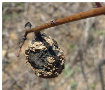
Momie de pêche (fruit monilié sec)

On constate en effet un nombre important de momies dans certains vergers de pêchers.