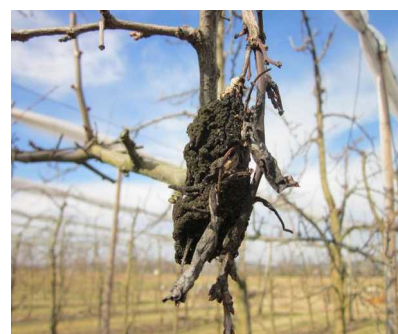
Fruits momifiés

Évaluation du risque : On observe beaucoup de momies en verger cette année. Elles seront, avec les chancres, le point de départ des nouvelles contaminations. La forte pression de l'an dernier amènera un inoculum fort dans les parcelles avec dégâts en 2017. Il faut diminuer au maximum les risques en éliminant rapidement les momies et les chancres.