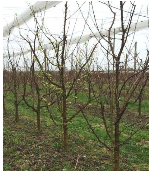
Arbre malade à feuillaison précoce

Techniques alternatives : L'application d'argile en barrière physique présente un intérêt certain en complément de l'arrachage des arbres malades. Elle est à réaliser dès maintenant sur les variétés précoces au débourrement, avant le début du vol du psylle.