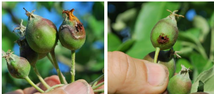
Dégâts d'hoplocampe

On observe cette année de nombreux dégâts d'hoplocampe en parcelles non traitées et quelques traces en vergers traités.