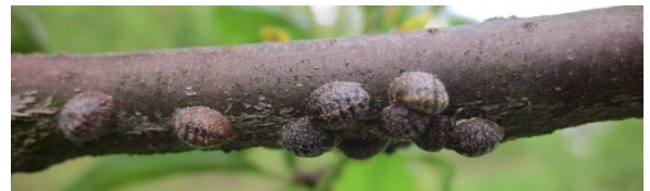
Lécanines adultes avec boucliers

On observe cette année beaucoup de parasitisme/prédation avec des boucliers femelles dévorés de l'intérieur (seulement des restes visibles sous les boucliers).