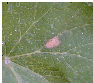
Tache de black-rot en cours de sortie