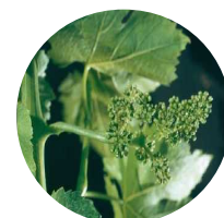
Stade 17: Boutons floraux séparés

Le stade 17 « Boutons floraux séparés » est désormais généralisé.