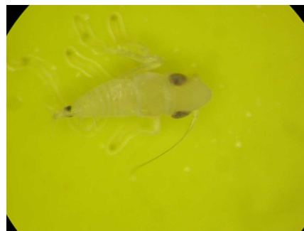
Larve de S. titanus vue à la loupe binoculaire (taille réelle 2 mm)

Cette cicadelle n'a qu'une seule génération par an. Les œufs éclosent dans le courant du mois de mai pour donner naissance à une larve. Puis cinq stades larvaires se succèdent. Six à huit semaines après les premières éclosions, les premiers adultes apparaissent. La période des éclosions peut être très étalée. Les larves naissent saines mais peuvent rapidement acquérir le phytoplasme si elles se nourrissent sur un cep conta-miné. Un mois plus tard, elles deviennent infectieuses et peuvent transmettre le phytoplasme à d'autres souches. Les nouveaux pieds ainsi contaminés n'exprimeront les symptômes que l'année suivante.