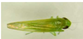
Cicadelle vert : Adulte (en haut) 1 er stade larvaire (en bas)

Les ébauches des ailes apparaissent dès le 4 e stade. Les symptômes causés sont appelés des grillures. Il s'agit de rougissement sur cépages rouges et de jaunissement sur cépages blancs délimités par les nervures. Ces rougissements/jaunissements partent du bord de la feuille et progressent vers le centre. Par la suite, les parties colorées peuvent se dessécher.