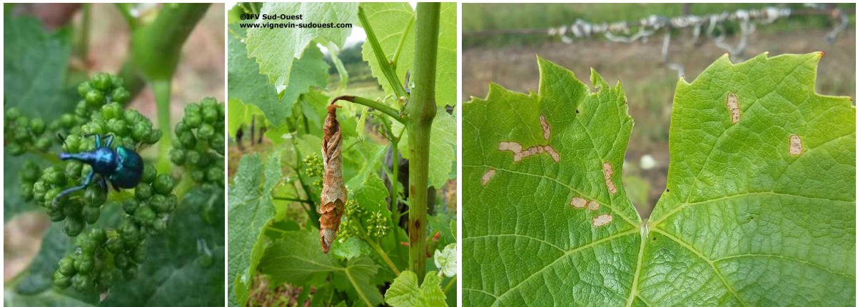
A gauche : insecte adulte

Les symptômes semblent plus fréquents qu'à l'accoutumé. Pour autant, ce phénomène reste sans incidence pour la vigne.