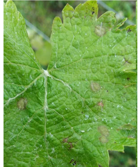
Black-Rot : Taches foliaires « fraîches » non sporulées

Dans les situations sensibles (parcelles à historique et présence d'inoculum), il existe un risque de contamination à chaque pluie. Surveillez l'évolution de la situation sanitaire de vos parcelles, car en présence significative de taches, un risque de repiquage pourrait s'ajouter au risque de nouvelles contaminations primaires.