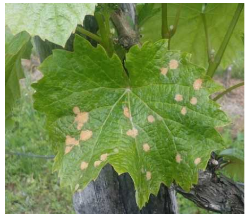
Black-Rot : Taches foliaires « fraîches » non sporulées « coup de fusil »