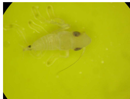
Larve de S. titanus vue à la loupe binoculaire (taille réelle 2 mm)

Cette cicadelle n'a qu'une seule génération par an. Les œufs éclosent dans le courant du mois de mai pour donner naissance à une larve. Puis cinq stades larvaires se succèdent. Six à huit semaines après les premières éclosions, les premiers adultes apparaissent. La période des éclosions peut être très étalée. Les larves naissent saines mais peuvent rapidement acquérir le phytoplasme si elles se nourrissent sur un cep conta-miné. Un mois plus tard, elles deviennent infectieuses et peuvent transmettre le phytoplasme à d'autres souches. Les nouveaux pieds ainsi contaminés n'exprimeront les symptômes que l'année suivante.