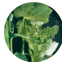
Stade 17 : Boutons floraux séparés