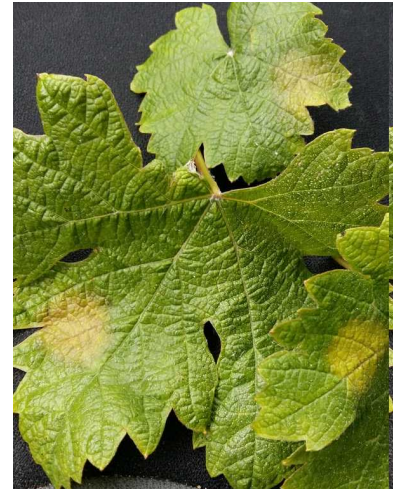
Mildiou – Taches d'huile

Des contaminations élites restent possibles dès 2 mm.