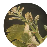
Stade 15 : Boutons floraux agglomérés

L'avance de phénologie observée jusque-là et évaluée à une dizaine de jours pourrait s'être fortement réduite à l'issue de la période de froid prolongée que nous venons de connaître.