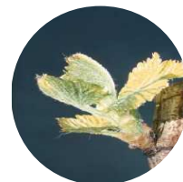
Stade 9 : 2-3 feuilles étalées

Action pilotée par le Ministère chargé de l'agriculture, avec l'appui financier de l'Office national de l'eau et des milieux aquatiques, par les crédits issus de la redevance pour pollutions diffuses attribués au financement du plan Ecophyto 2018.