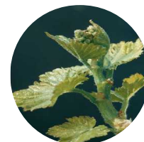
Stade 12 : Inflorescences visibles