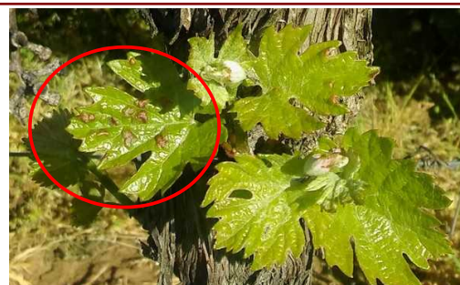
Erinose: Apparition des premières galles sur jeunes feuilles

Les symptômes sont bien entendu les plus visibles là où la végétation est la plus développée.