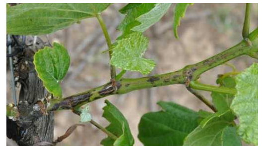
Excoriose : Lésion sur jeune rameau

Évaluation du risque : A l'exception de ces situations les plus tardives, la période de risque touche à son terme. Quand 100 % des bourgeons ont dépassé le stade 2-3 feuilles étalées, il devient inutile d'intervenir car la croissance a placé la partie terminale sensible du sarment hors de portée du champignon présent dans les lésions à la base des rameaux.