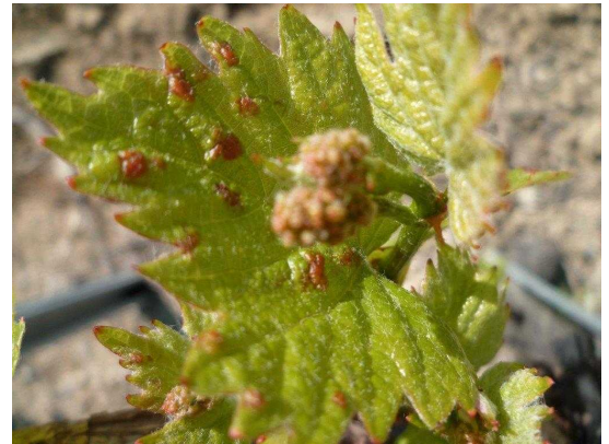
Erinose : Galles sur feuilles jeunes

Évaluation du risque : On note une nette recrudescence des symptômes d'érinose, depuis 2 à 3 ans. Cette pression s'exprime ponctuellement, mais peut aller jusqu'à des dégâts sur grappes sur les quelques cas les plus critiques. La surveillance doit être accrue sur les parcelles ayant subi de fortes attaques d'érinose lors des campagnes précédentes. La gestion du risque vis-à-vis de l'érinose dans les parcelles les plus sensibles repose sur une régulation précoce des populations, avant leur phase de multiplication.