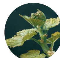
Stade 12 : Inflorescences visibles