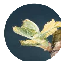
Stade 9 : 2-3 feuilles étalées

L'avance d'une dizaine de jours par rapport à la campagne précédente se confirme cette semaine encore.