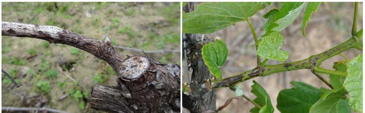
Excoriose : à gauche : chancres d'excoriose sur bois d'un an à droite : Lésion sur jeune rameau

La période de sensibilité de la vigne s'étend du stade 6 (éclatement des bourgeons/sortie des feuilles) au stade 9 (premières feuilles étalées).