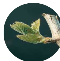
Stade 6 : Sortie des feuilles