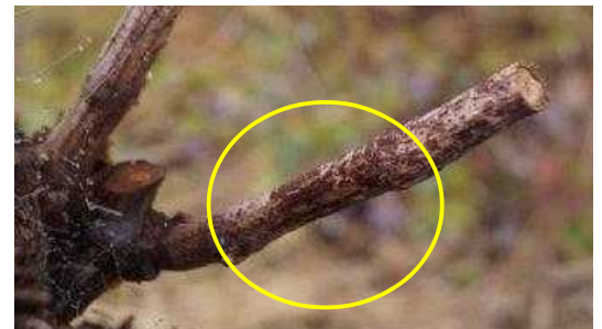
Excoriose : chancres d'excoriose sur bois d'un an

Les attaques apparaissent au printemps, sur les jeunes rameaux, peu après le débourrement, et se manifestent par des taches brun-noir parfois d'aspect liégeux à la hauteur des premiers entre-nœuds.