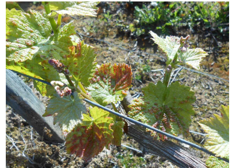
Erinose : Galles sur feuilles jeunes

Les femelles hivernent dans les écailles des bourgeons et colonisent très tôt les jeunes feuilles pour se nourrir et pondre. Très rapidement après le débourrement démarre une phase de reproduction de l'acarien au cours de laquelle seront produites les populations d'adultes des premières générations estivales qui vont migrer vers le bourgeon terminal et les nouvelles feuilles des rameaux. Cette migration démarre fin mai et s'intensifie après la floraison.