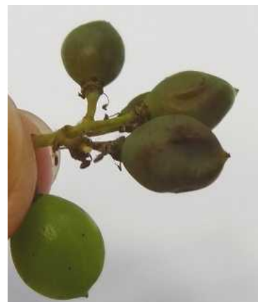
en haut : teinte violacée et baies desséchées – Photo CA 82 en bas : dépression en coup de pousse – Photo CA 31