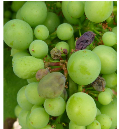
Mildiou sur grappe : faciès "rot brun"

Rappelons encore que les baies restent sensibles aux contaminations jusqu'à la véraison.