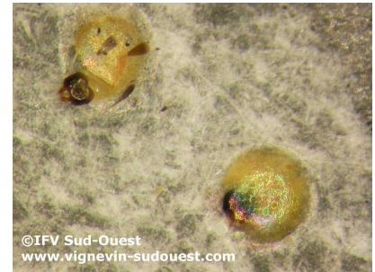
Œufs d'eudémis au stade "Tête noire"

La gestion de la deuxième génération du vers de grappe repose sur le suivi du dépôt des pontes et de leur évolution. La bonne évaluation du stade de développement de l'œuf est primordiale : le stade cible du ravageur est le stade « tête noire », stade précédant l'éclosion. L'objectif de ces stratégies étant de stopper l'activité des jeunes larves avant qu'elles ne perforent les baies.