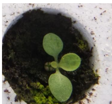
Cotylédons déployés (BBCH 1000)

Les semis de référence ont été effectués entre le 07 et le 15 mars. Au 12 avril, le stade observé est le stade croix (BBCH 1020). Sur les zones de La Fouillade (12) et Puch d'Agenais (47) le stade 4 feuilles (BBCH 1040) est atteint.