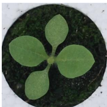
Stade croix (BBCH 1020)

Photo : S.Seguín – Périgord tabac (avril 2016)