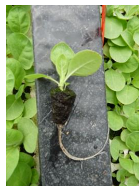
4 ème feuille déployée

Photo : C.Linon – Périgord Tabac (avril 2016)