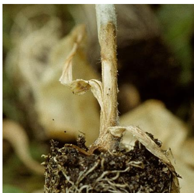
Botrytis sur tabac

http://www.aquitainagri.fr/fileadmin/documents_craa/BSV/TABAC/FICHES_BIO-AGRESSEURS/Fiche_Botrytis.pdf