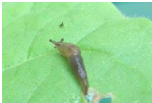
Limace sur feuille de tabac