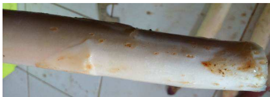
Dégâts de de myriapodes

En asperge blanche des dégâts de myriapodes (multiples petits trous ronds) et de taupins (gros trou) sur les turions sont observés.