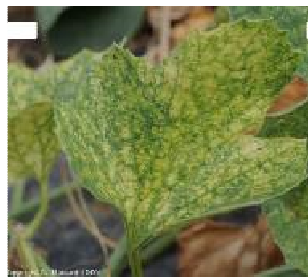
Symptômes d'acariens

Les premiers foyers d' acariens ( Tetranychus spp. ) sont détectés. Surveiller les parcelles et pour détecter les premiers symptômes, inspecter les feuilles à la base des plants. Les feuilles chlorosées sont couvertes d'une multitude de petites lésions chlorotiques à blanchâtres occasionnées par Tetranychus urticae (tétranique tisserand)