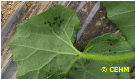
Puceron Aphis gossypii Adulte reconnaissable grâce à ses cornicules noires

De nombreux cas d'attaques de pucerons sont signalés aussi bien sur des parcelles en agriculture biologique que conventionnelle. Il faut être vigilant pour détecter les premiers foyers et arracher les plants infestés. Il faut repérer les foyers et surveiller leur évolution.