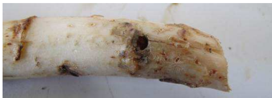
Dégâts de taupins