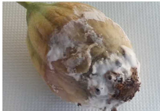
Dégâts de Sclérotinia sur fruit

Évaluation du risque : Avec la climatologie annoncée, le risque est faible.