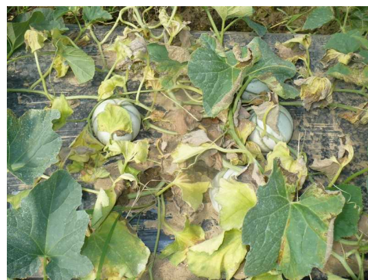
Phomopsis sur plant de melon

Des observations de Didymella sont suspectées.