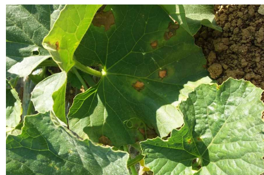
Symptômes de bactériose sur feuilles

Évaluation du risque : Le risque est faible à moyen. Il dépend de l'évolution des températures, des durées d'humectation du feuillage et des situations de parcelles.