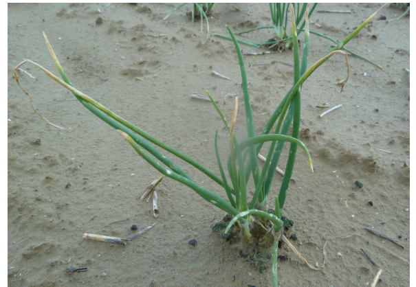
Botrytis squamosa sur oignon

Évaluation du risque : Le premier vol semble avoir démarré. La période de vol peut aller jusqu'à fin mai – début juin.