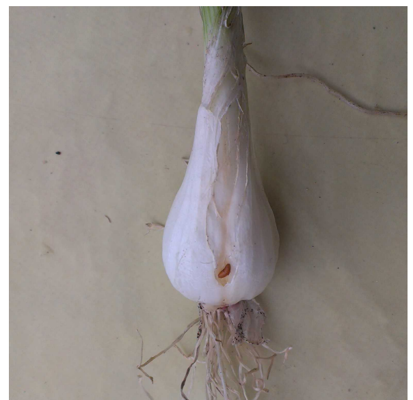
Pupe de phytomyza sur oignon

Courbe bleue : Vol des mouches Courbe rouge : Larves