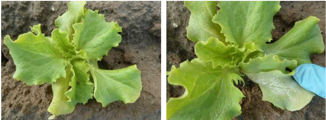
Symptômes de mildiou sur salade

Évaluation du risque : Risque moyen à fort. A ce jour, les faibles pluies prévues et la remontée des températures devraient être moins favorables au mildiou. Les prévisions météorologiques printanières étant néanmoins difficiles à établir et, tout de même proches des conditions optimales du développement de la maladie, le risque persiste.