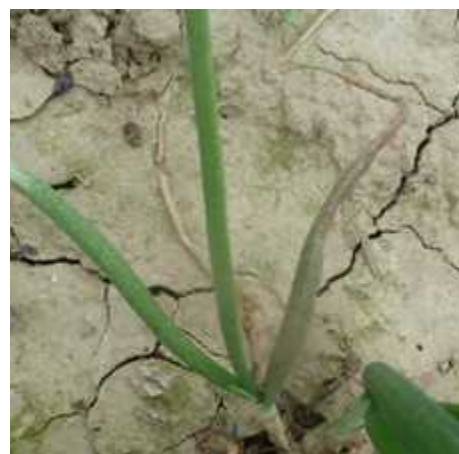
Mildiou sur oignon

Le mildiou est également toujours présent sur les oignons de Trébons, sans que la pression ne soit trop forte pour l'instant.