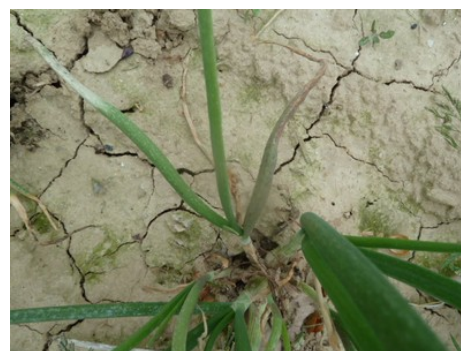
Mildiou sur oignon

Évaluation du risque : Risque élevé. La maladie est déclarée dans plusieurs parcelles et des contaminations sont en cours. Des sorties de taches sont encore prévues dans les prochains jours.