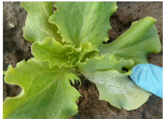
Symptômes de mildiou sur salade