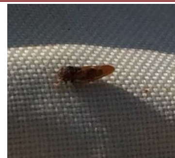
Psylle du prunier

Évaluation du risque : La période de risque est toujours en cours malgré un vol ralenti des psylles.