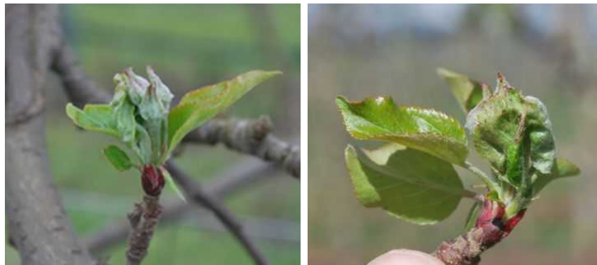
Dégâts de Capua sur bouquets floraux de pommier

Seuil de nuisibilité : 5% de bouquets atteints