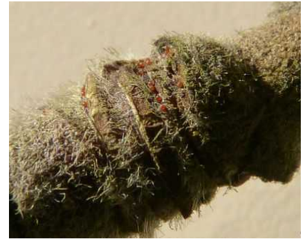
Œufs d'hiver d'acariens sur rameau

La première mue sous bouclier est maintenant terminée.